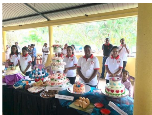
Viele schöne und sicher feine Kreationen