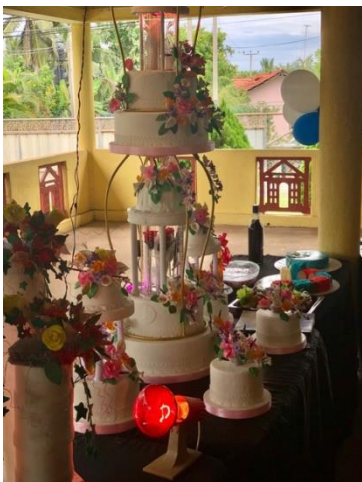
Eine wunderschöne Hochzeitstorte